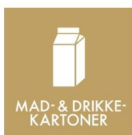
MAD- &amp; DRIKKE-KARTONER