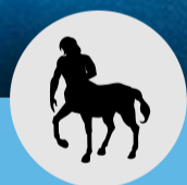
Figur 1.1: Genreoversigt

Opdigtede fortællinger, som bliver fortalt med lydeffekter og stemningsmusik. Kan også gå under betegnelsen radiodrama, hvis der bruges mere teatraliske virkemidler som skuespil.